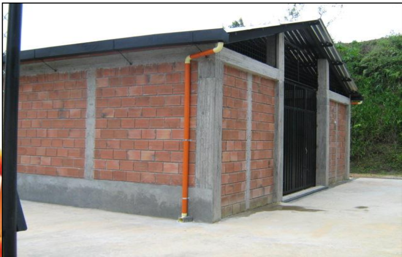
CENTRO DE ACOPIO DE CORDOBA