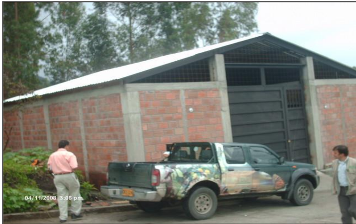
CENTRO DE ACOPIO DE SALENTO