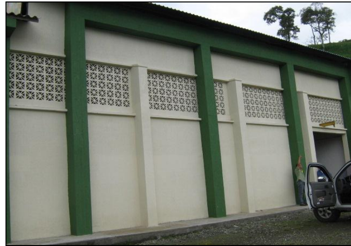
CENTRO DE ACOPIO DE MONTENEGRO