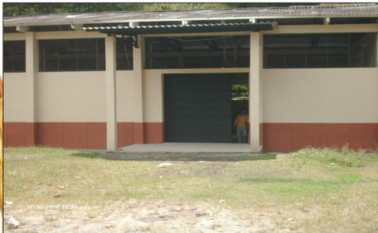
CENTRO DE ACOPIO DE QUIMBAYA