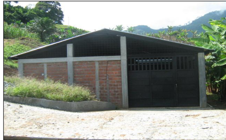
CENTRO DE ACOPIO DE BUENAVISTA