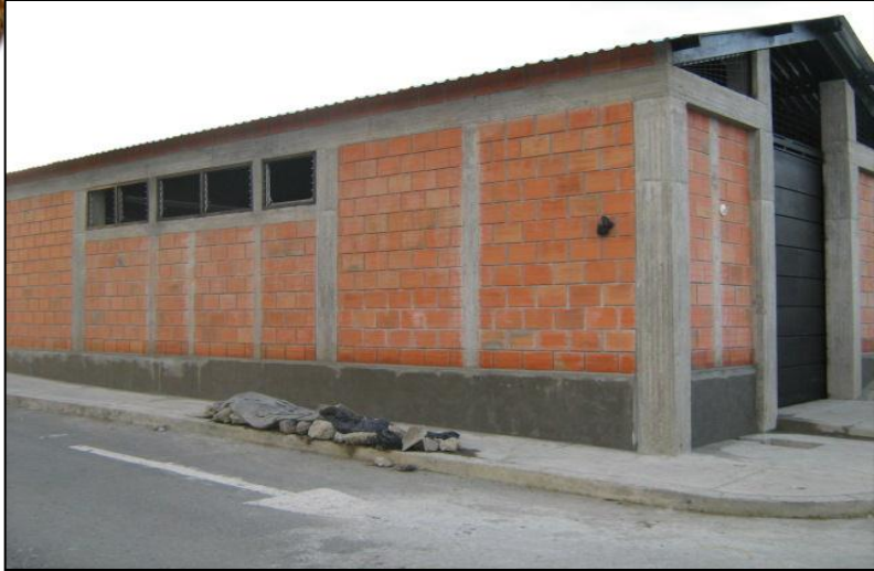
CENTRO DE ACOPIO DE CIRCASIA